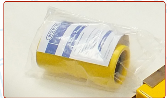
Wavin koppelstukken voor de gele leidingen. Zij worden per stuk verpakt.

Ook op het gebied van duurzaamheidsstandaarden voldoet Wavin aan de laatste eisen. "Toen een klant vroeg om een plastic zak om elk product, zijn we ons gaan oriënteren naar de mogelijkheden." vertelt Henry: "Wij moesten aan de eis voldoen, maar vroegen ons af wat de beste oplossing daarvoor was?"